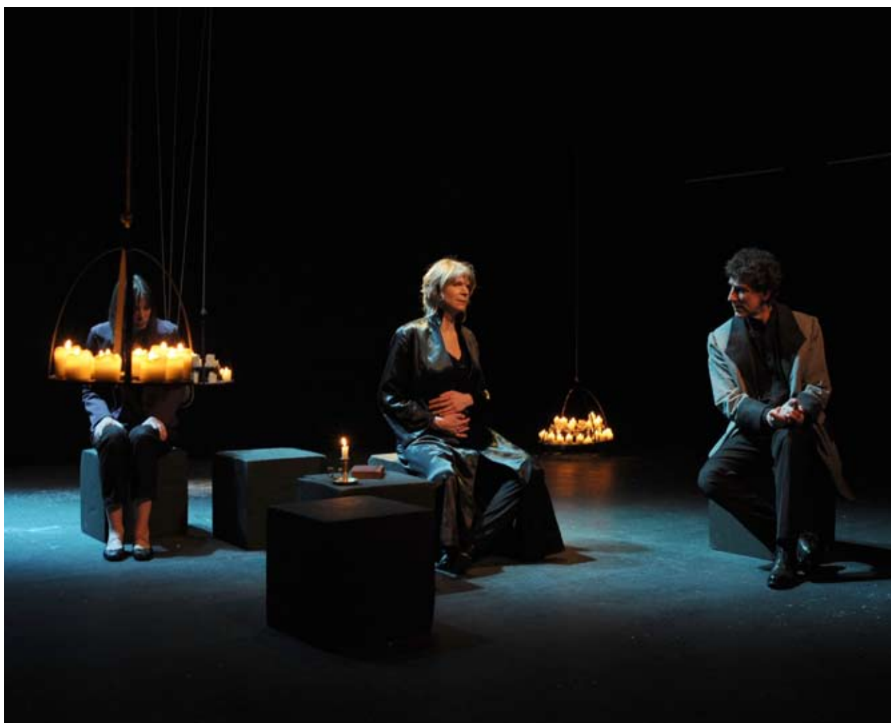
LE CHANT D'ANDROMAQUE, LE CRI D'HERMIONE_CIE KRAJEWSKI – GIORGIO BRASEY

Les créations suivantes: Le Chant d'Andromaque – le cri d'Hermione , L'Iliade , ou Andromaque – la tentation d'une autre beauté , d'après J.Racine, A. Baricco et Euripide signalent la recherche d'une juste médiation entre l'univers des mythes, une parole et un dire contemporains.